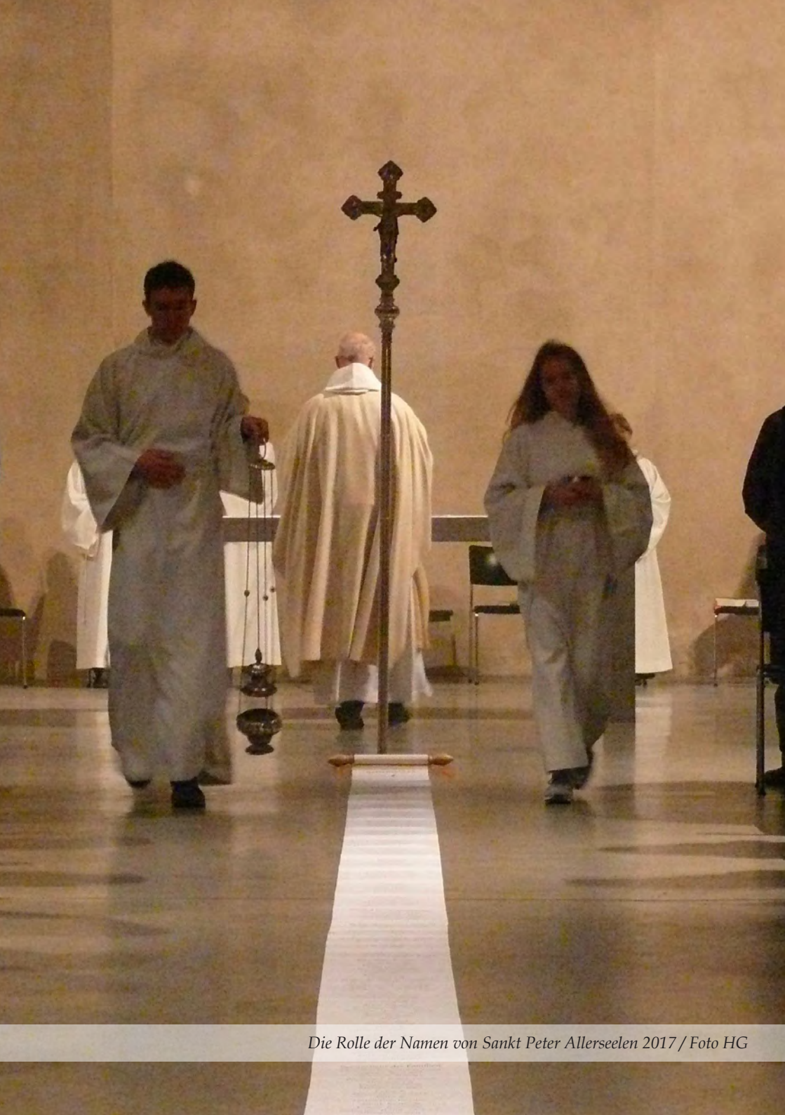
Die Rolle der Namen von Sankt Peter Allerseelen 2017